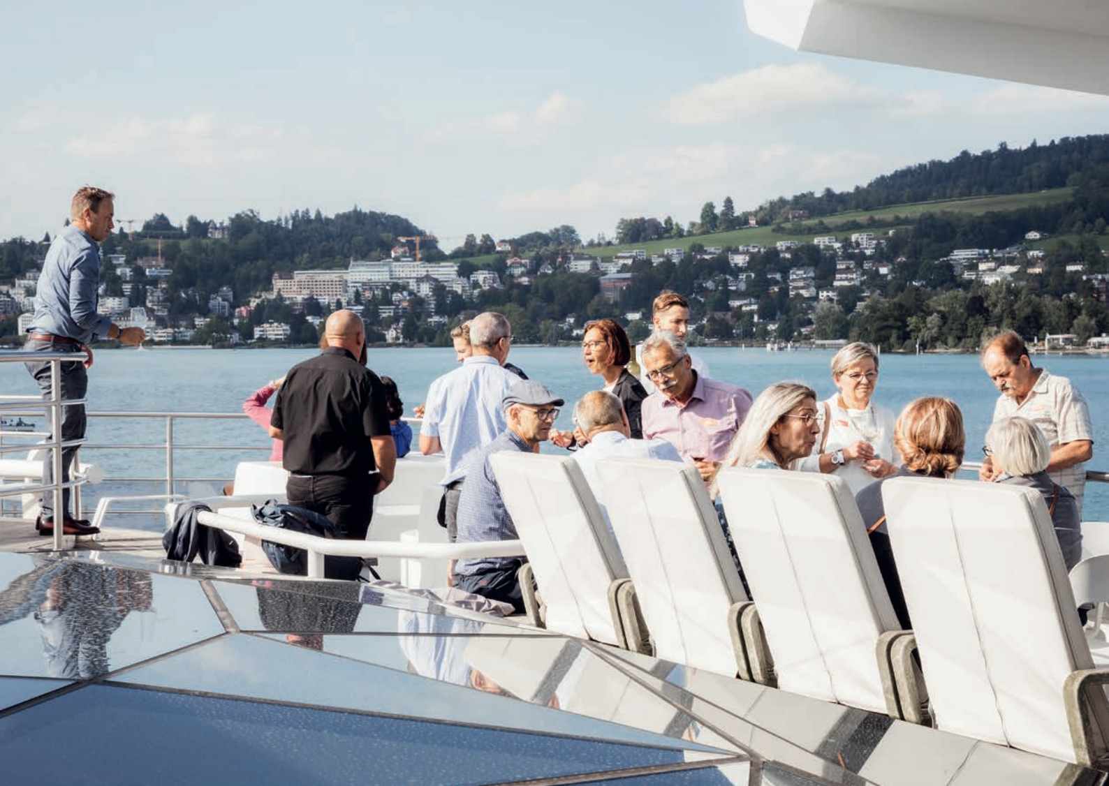
Abfahrt mit der MS Diamant nach Vitznau.