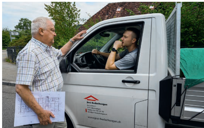
Travailler sur un chantier requiert des connaissances spécialisées, de l'étanchéité à l'installation photovoltaïque.

Mais les toits ne m'ont pas lâché. J'ai effectué un deuxième apprentissage, cette fois de couvreur, et après mon diplôme, je me suis lancé dans celui d'étanchéur CFC, ce qui ne m'a pris qu'une année supplémentaire. Ces trois diplômes m'apportent tous quelque chose, chacun à sa manière. Aujourd'hui encore, j'adore travailler sur des toits plats, mais aussi effectuer la planification, la préparation du travail et l'exécution sur des toits inclinés. Et mes connaissances en moto me sont souvent très utiles, par exemple lors de la planification d'installations photovoltaïques, quand il est aussi question de courant continu et de courant alternatif ou quand je répare moi-même une tronçonneuse défectueuse. Tout ce que j'ai appris me sert toujours à un moment donné.