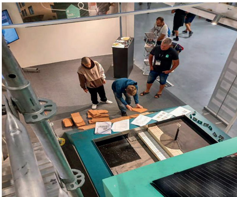
BAM in Bern.