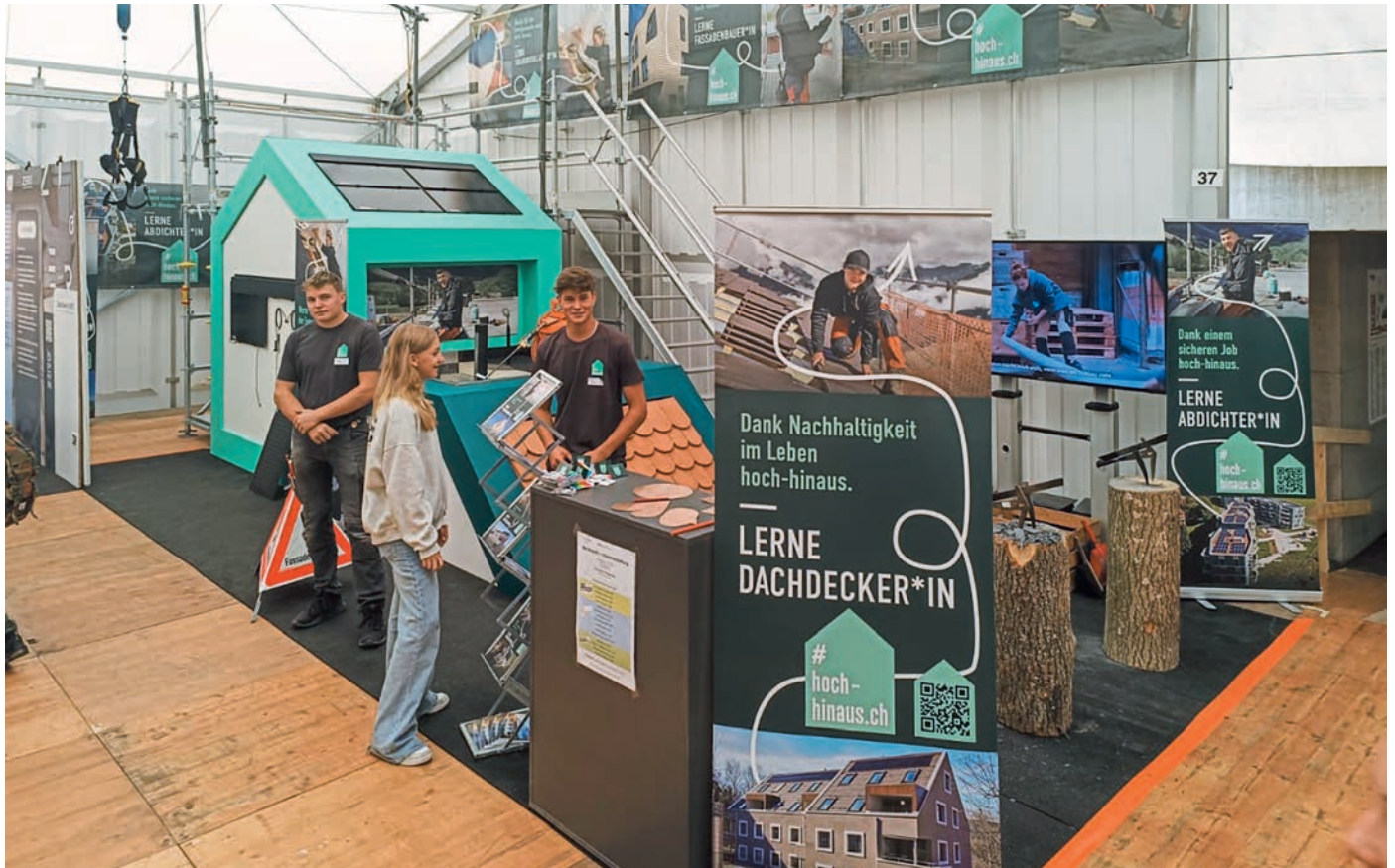
Thurgauer Berufsmesse in Weinfelden.

Nachwuchsförderung Der neue Messestand wurde bereits von verschiedenen Sektionen ausgeliehen. Das Echo war durchwegs positiv.