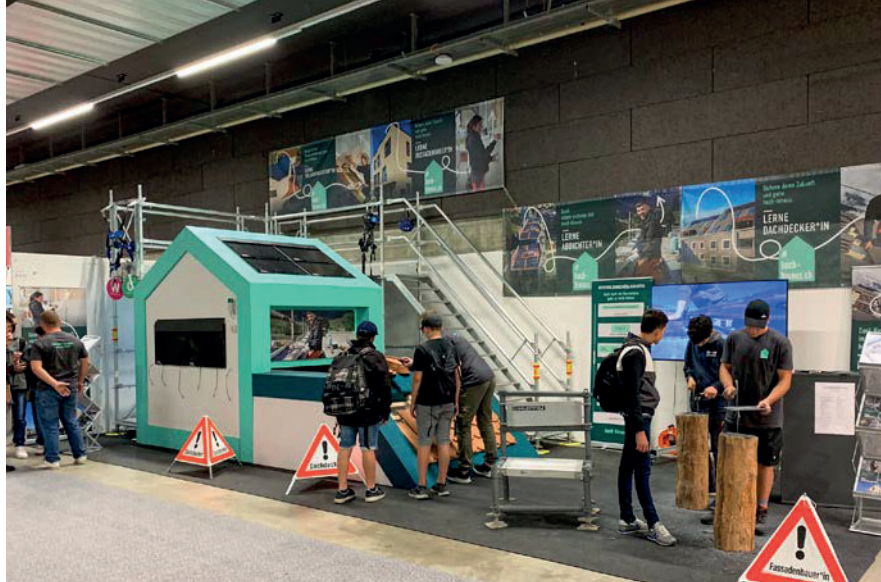
OBA in St.Gallen.

Ab diesem Jahr haben wir auf eine Zusammenarbeit mit einem Messebauer verzichtet und die Organisation und Verantwortung liegt bei den Sektionen. Das Messematerial ist in Uzwil gelagert und kann für Berufsmessen oder sonstige Veranstaltungen reserviert werden. Der Transport sowie der Auf- und Abbau ist Sache der Sektionen, auf Wunsch organisieren wir den Transport für sie. Die Feedbacks fielen positiv aus und die Sektionen würden den Messestand auch nächstes Jahr wieder bestellen.