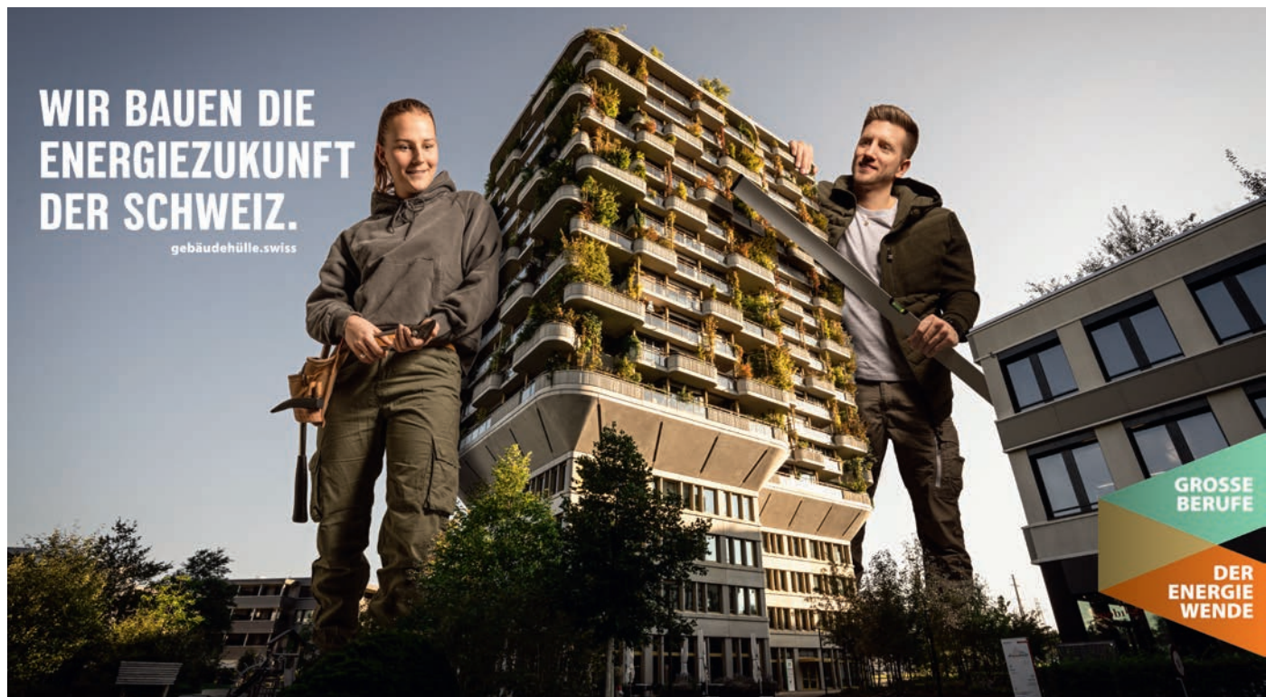
Sujet Dachkampagne «Grosse Berufe der Energiewende» mit Bauprofis und Gebäude.

Nachwuchsförderung Für die im Frühsommer lancierte Dachkampagne «Grosse Berufe der Energiewende» gilt es für die nächsten Etappen ab 2025 Gas zu geben.