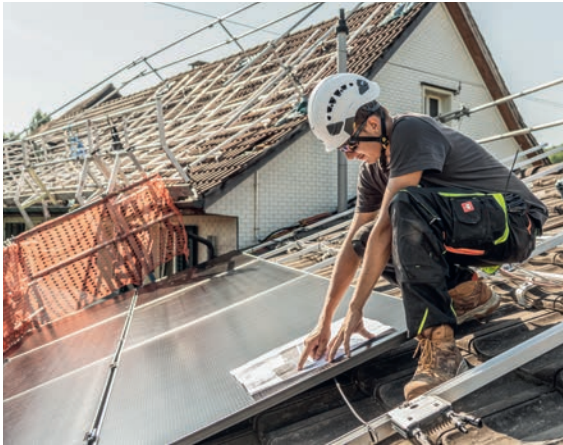
Bevor die Arbeiten der neuen Aufdachanlage weitergeführt werden können, studiert Daniel Sommer den Plan.