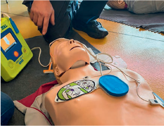
Elektroden vom Defibrillator richtig setzen.