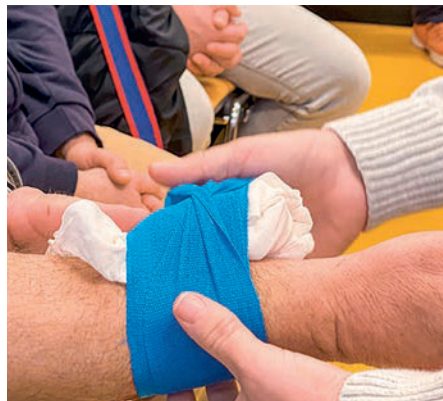
Druckverband am Unterarm.

Damit ihre Mitarbeiter sicher Ersthilfe leisten können, haben die Sektionen Stadt Zürich und Zürich See einen Erste-Hilfe-Refresher-Kurs organisiert. Während sieben Kurstagen wurden in den Räumlichkeiten von Schutz und Rettung Zürich im Glattpark 224 Teilnehmer auf den neuesten Stand der Ersten Hilfe gebracht. In vier Stunden wurden den Kursteilnehmern die wichtigsten lebensrettenden